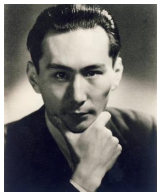
ベルリン・フィル公式 ポートレート