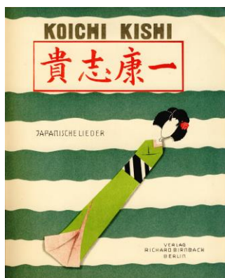
貴志康一制作の楽譜

◎ 入場券 (全指定席): S 席 7000円, A 席 5000円 ◎チケット発売日: 2025 年1月11日(土) ・二期会チケットセンター: 03-3796-1831 (平日 10:00~18:00 / 土曜 10:00~15:00 / 日・祝休業) ・サントリーホールチケットセンター: 0570-55-0017 (10:00~18:00 / 休館日・年末年始を除く) ・チケットぴあ(Pコード 282-858) / https://t.pia.jp